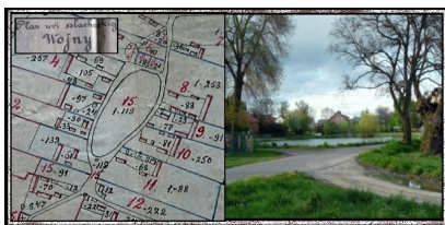
Foto: Fragment mapy: „Plan wsi szlacheckiej Wojny z 1914r. ”. Foto: Współczesny widok z charakterystycznym bardzo ładnym stawem niezmiennym od wielu lat. Wojny -2008r.

Wyrażone poglądy w tym zakresie mają jak najbardziej słuszne uzasadnienia. Mogą one przyczynić się do dalszych badań i rozważań, w tym uzupełnienia i poznania nowych faktów, które wzbogaciłyby dotychczasowy stan wiedzy. Byłoby to pięknym ukłonem w kierunku poznania tak wartościowego i znaczącego tematu.