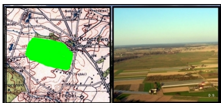
Foto: Mapa z naniesieniem obszaru lotniska polowego w Kroczewie. Foto: Lotnisko polowe od strony zachodniej -2008 r. Pole wzlotów trawiaste z orientacją wschód - zachód.

W lipcu 1945 roku Sztab Generalny WP wprowadził istotne zmiany w koncepcji lotnictwa WP. Dokonano rozformowania niektórych jednostek lotniczych, tworząc w ich miejsce nowe nazewnictwa i numeracje wraz z konkretną lokalizacją na terenie kraju. W tym okresie rozpoczęto również reformowanie szkolnictwa lotniczego. Nowe sposoby organizacji i działań miały ukształtować pokojową strukturę lotnictwa wojskowego.