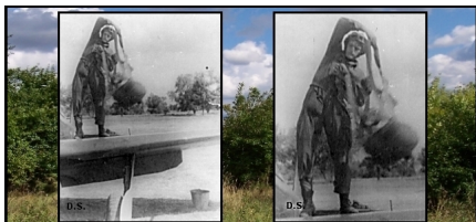
Foto: Lotnisko polowe w Kroczewie. Pilot 1. plm „Warszawa” na skrzydle samolotu myśliwskiego Jak-3 . Powiększenie : Pilot myśliwca trzymający za uprząż spadochron siedzeniowy.-1945/1946r.(?)

Kadra oficerska w tym czasie zakwaterowana była również w prywatnych domach mieszkańców Kroczewa.