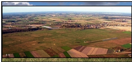
Foto: Dawne lotnisko polowe WP w Kroczewie od strony południowej - 2008 r.

Wpisany przez O.M. wtorek, 14 grudnia 2010 23:01