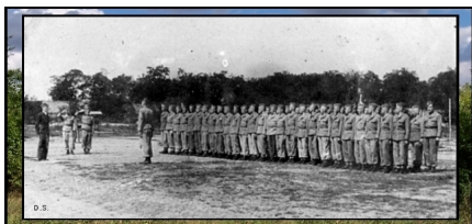
Foto: Żołnierze 4. plsz na placu apelowym w czasie obozu letniego w Kroczewie -1948 r.

) zarówno na lotnisku w Kroczewie jak i w Dęblinie. 4 eskadra szkolenia podstawowego znajdowała się na lotnisku Podlódów.